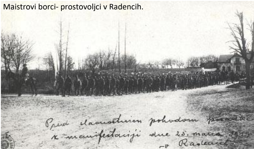
Maistrovi borci- prostovoljci v Radencih.

Umrli je 26. julija 1934. Pokopan je na pobreškem pokopališču v Mariboru.